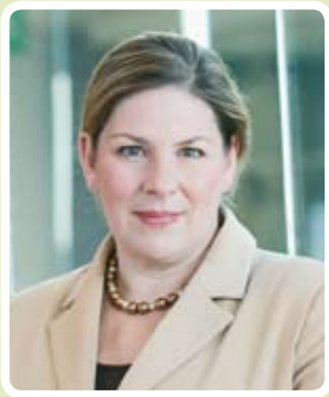
Dr. Andrea Kdolsky Bundesministerin für Gesundheit, Familie und Jugend