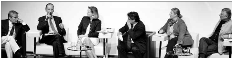
Angeregte Diskutanten bei den Kommunalen Sommergesprächen