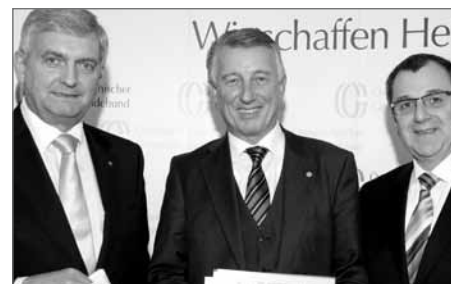
Gemeindebundpräsidium einstimmig im Amt bestätigt: Präsident Mödlhammer mit seinen beiden „Vize“ Riedl und Dworak

Im Rahmen der Bundesvorstandssitzung am 28. Februar 2012 wurde Präsident Helmut Mödlhammer und seine beiden Vizepräsidenten Bgm. Mag. Alfred Riedl und Bgm. Rupert Dworak für eine weitere Periode in ihrem Amt einstimmig bestätigt. Mödlhammer steht seit 1999 an der Spitze des Österreichischen Gemeindebundes. Präsident Mödlhammer dankte für das ent-