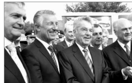
Am Gemeindetag 2012